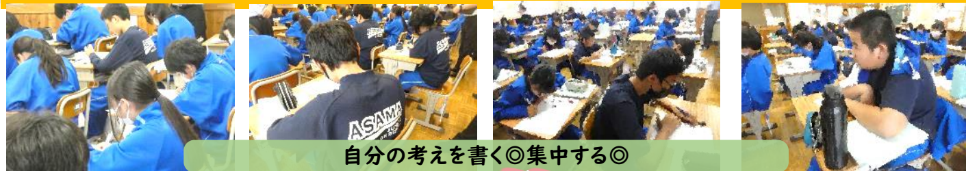
自分の考えを書く◎集中する◎

お釣りを求める数量関係や速さを求める数量関係を文字の式に表せるか考え合いました。