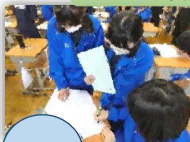
つぶやき◎ 説明する◎