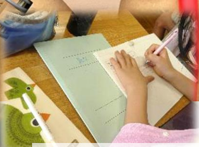
自分の考えが書けている◎

「小さい方をXとすると大きい方はX+1となる」「Xは正の整数なので」「したがって」などの言葉を使って説明しました。