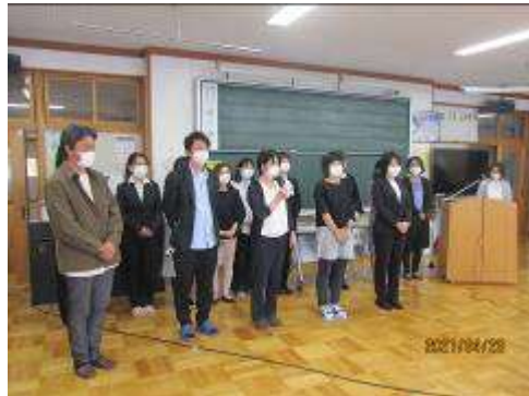
新役員の方々の紹介