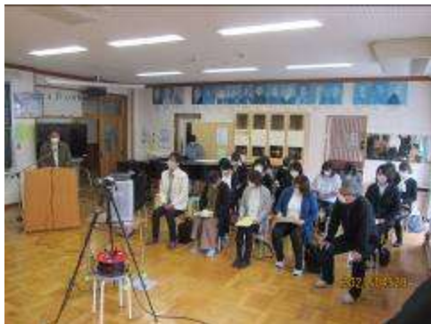
音楽室にてPTA総会を実施