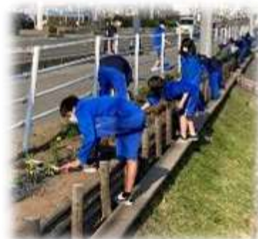
美化委員による作業の様子

浅間中学校では、佐久建設事務所が行っている「アダプトシステム（信州ふるさとの道ふれあい事業）」を活用して県道下仁田浅科線の歩道沿いのスペースに花壇を設置し、継続的に美化活動を進めています。今年度も5月下旬に届いた「サルビア（赤・青）」、「マリーゴールド」