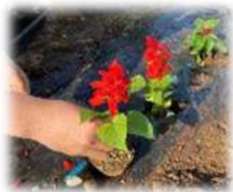
一株一株を大切に植えました

本校を訪れる皆さんや道路を利用する皆さんの心を少しでも癒やすことができれば嬉しいです。これから雑草と格闘する時期でもありますが、各クラスで協力して、いただいた大切な命を育てていきたいと思えます。ご来校の際はぜひ、お子さんのクラスの花壇をご覧ください。