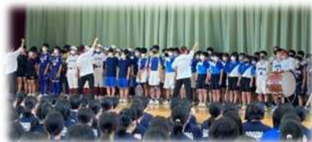
6/11 東信予選(球技・水泳)壮行会 次回は県大会壮行会です

コロナ禍で練習試合の制限等のある中、選手の皆さんと顧問の先生方は短時間で効果的な練習の在り方や感染症予防に配慮した練習の工夫を継続してきました。経験したことのない状況を乗り越えた皆さん、浅間中学校の健闘をみんなが祈っています。精一杯力を発揮してください。