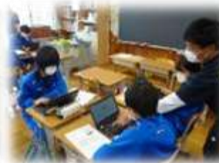
はじめてログインする生徒たち