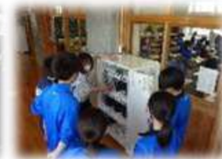
各教室にある充電保管庫